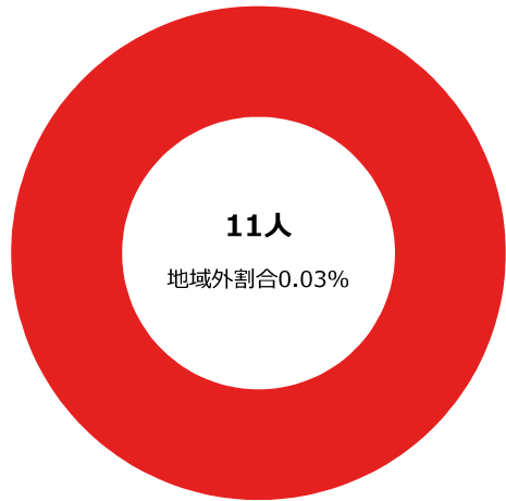
滞在人口/都道府県外ランキング 上位10件