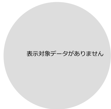
滞在人口/都道府県外ランキング 上位10件